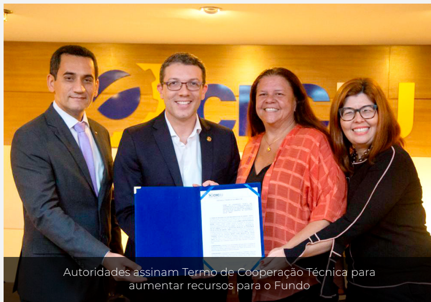
Autoridades assinam Termo de Cooperação Técnica para aumentar recursos para o Fundo

Em uma ação para impulsionar as doações ao Fundo Municipal para Atendimento dos Direitos da Criança e do Adolescente (FMADCA), o CMDCA assinou, no dia 22 de março, um convênio com o Conselho Regional de Contabilidade do Rio de Janeiro e a Secretaria Municipal de Assistência Social do Rio de Janeiro. A proposta é que os contadores sensibilizem os seus clientes a doarem para o Fundo, uma vez que estamos em época de confecção do Imposto de Renda, mas a parceria também prevê capacitações conjuntas.