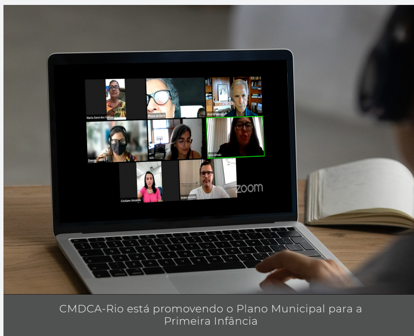
CMDCA-Rio está promovendo o Plano Municipal para a Primeira Infância