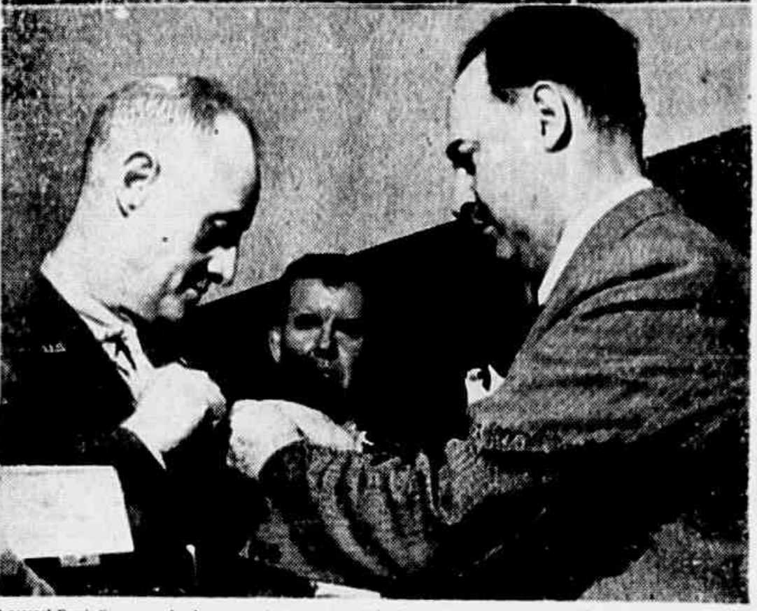
General Frank Knox quando almoçava, ontem, em companhia do sr. Salgado Filho e altas patentes militares e o ministro da Aeronáutica conferenciando o general Walsh

Deverão ser apresentados ao Ministério da Guerra, no dia 21 de outubro, os reservistas chamados ao 2º Regimento de Infantaria, até o dia 5 do corrente, a seguir: os chamados ao 1º, 2º, 3º, 4º, 5º, 6º, 7º, 8º, 9º, 10º, 11º, 12º, 13º, 14º, 15º, 16º, 17º, 18º, 19º, 20º, 21º, 22º, 23º, 24º, 25º, 26º, 27º, 28º, 29º, 30º, 31º, 32º, 33º, 34º, 35º, 36º, 37º, 38º, 39º, 40º, 41º, 42º, 43º, 44º, 45º, 46º, 47º, 48º, 49º, 50º, 51º, 52º, 53º, 54º, 55º, 56º, 57º, 58º, 59º, 60º, 61º, 62º, 63º, 64º, 65º, 66º, 67º, 68º, 69º, 70º, 71º, 72º, 73º, 74º, 75º, 76º, 77º, 78º, 79º, 80º, 81º, 82º, 83º, 84º, 85º, 86º, 87º, 88º, 89º, 90º, 91º, 92º, 93º, 94º, 95º, 96º, 97º, 98º, 99º, 100º.