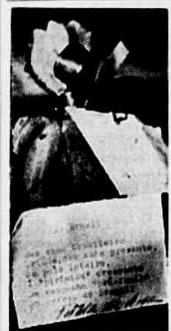
BEBAM PELA VITÓRIA DO BRASIL — Depõem as tampas das garrafas nos sacos de esôla para a Pirâmide "Brasil" (Texto em outro local)

ANO XIV — Sexta-feira, 2 de Outubro de 1942 — N. 3.587