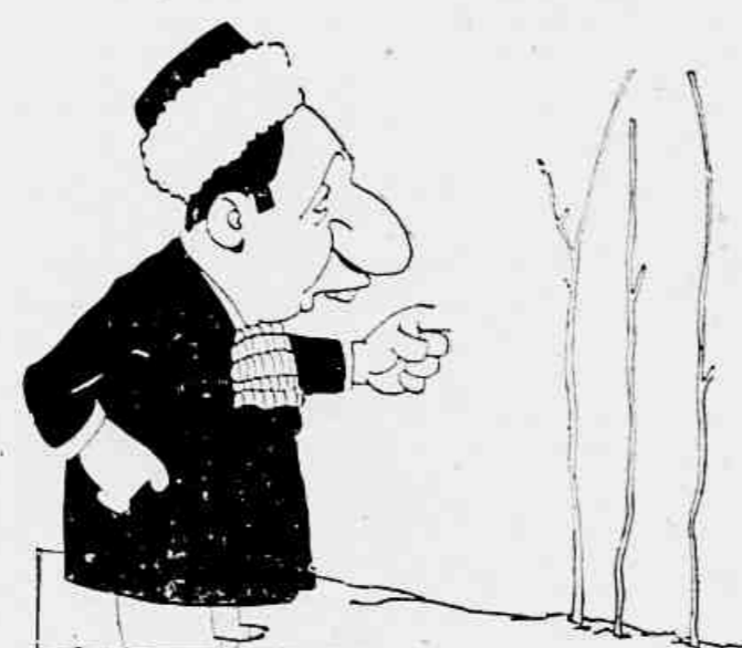
O juiz funcionar na 3.ª Varc...

COISAS PODEROSAS E BRUCAS MARTINIANO IMPOSSIVEIS