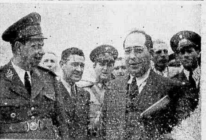
A CHEGADA DO INTERVENTOR CORDEIRO DE FARIAS AO RIO — Pelo avião da Panair chegou ontem ao Rio, procedente de Porto Alegre, o general Cordeiro de Farias, interventor federal no Estado do Rio Grande do Sul. O desembarque do chefe do governo gaúcho foi bastante concorrido, achando-se presentes, entre as pessoas que lhe foram apresentar cumprimentos, o representante do presidente da República, representantes dos ministros da Marinha, Aeronáutica, Justiça e Trabalho, representantes do governador geral do D. I. P., o procurador do Estado do Rio Grande do Sul, além de outras altas autoridades civis e militares. Na foto acima vê-se o interventor gaúcho em palestra com o general Góes Monteiro.

LONDRES, 2 (R.) — Os aeroplanos "fantasmas" da RAF caçam agora submarinos e conquistam o domínio dos ares, sobre a baía de Biscaya.