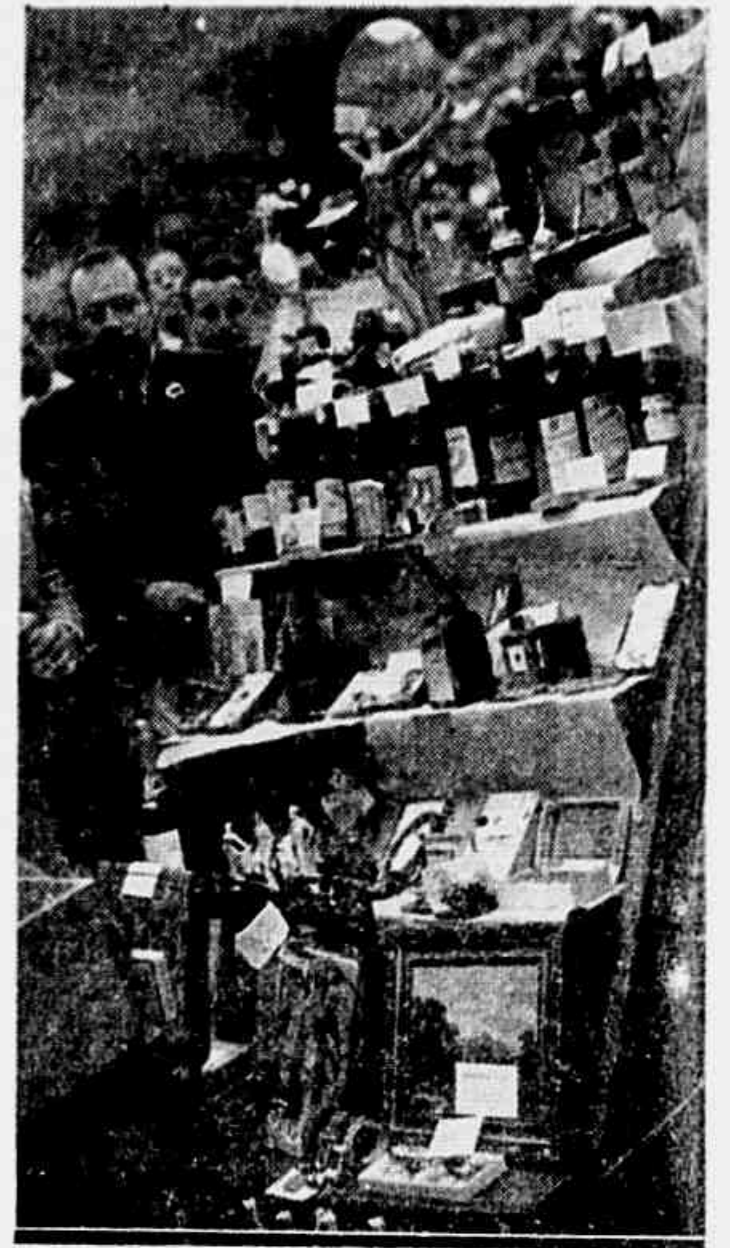
Algumas das numerosas prendas que os amigos e freqüentes da "Cantina Carioca" reuniram para a serie de leilões "Brasil", em benefício do "Arará"