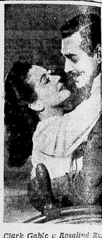
Clark Gable e Rosalind Russell, nos esplêndidos intérpretes de "Aventura no Oriente", agora no Metro Passio