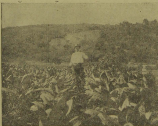
Uma plantação de fumo “chinês”, no Instituto Agronomico Vidal de Negreiros

O chefe do governo assiste a uma experiencia da estufa construida no primeiro daquelles estabelecimentos, para beneficiamento do fumo em folha