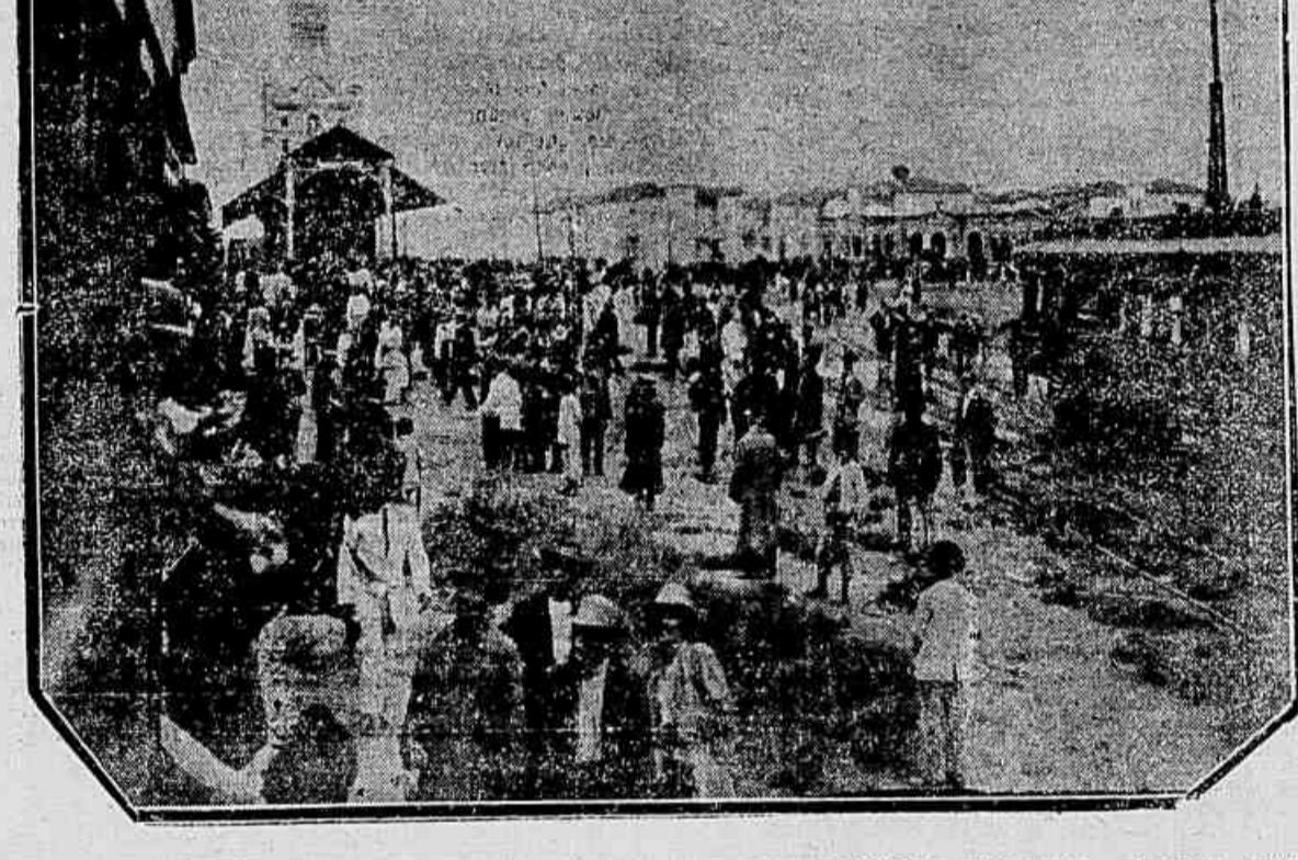
UM ASPECTO DA VISITA A'S VILLAS OPERARIAS - A ESCOLA PRIMARIA FEMININA, HONTEM INAUGURADA - O MARECHAL E SUA COMITIVA EQUILIBRANDO-SE SOBRE UMA PONTE IMPROVISADA NAS XIMIDADES DA ESTAÇÃO, PARA EVITAR A HUMIDADE.