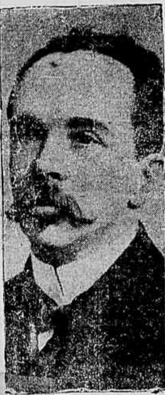
Senador LAURO SODRÉ

ALHEIAMENTO DOS LAURISTAS E COELHISTAS ÀS MANOBRAS DA POLITIQUE