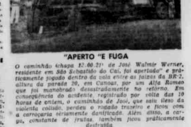
"APERTO" E FUGA