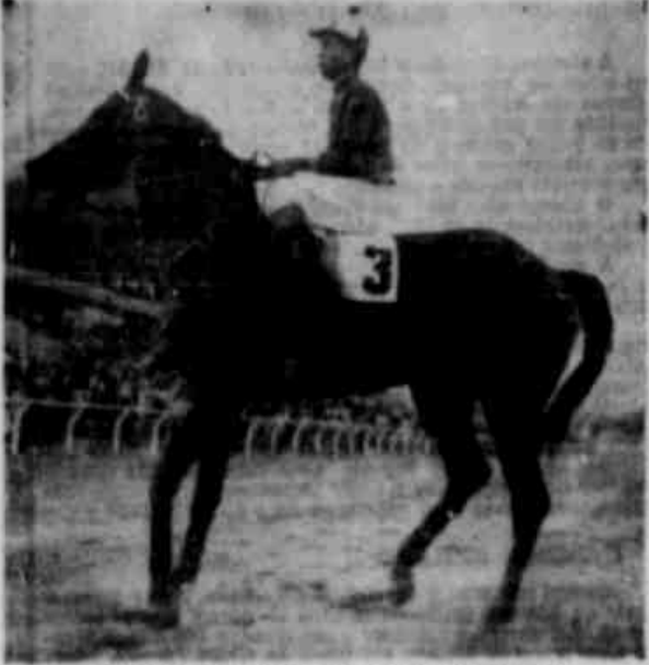
PRETOR: O LAUREADO DO "RAINHA DA FRONTEIRA"

Pretor, um produto alçado do "Arado", conquistou difícil vitória sobre o paulista Livorno, no VI GP "Rainha da Fronteira" disputada domingo, perante enorme multidão, no hipódromo Viaconde Ribeiro de Magalhães.