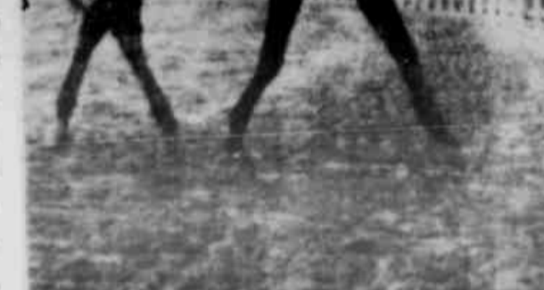
PRETOR VENCEU COM MÉRITO O GP RAINHA DA FRONTEIRA Pretor venceu, com mérito, o Grande Prêmio "Rainha da Fronteira", principal competição da tarde turfística de domingo, desdobrada no hipódromo do Cristal.