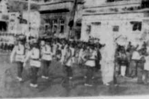
90.º ANIVERSARIO Aspecto do desfile da Escola de Cadetes da Brigada Militar, em Montenegro...