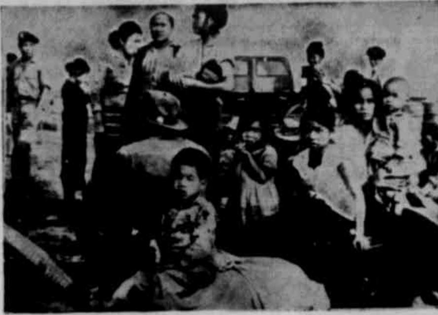
REFUGIADOS DO LAOS

WASHINGTON, 13 (UPI) — Mais de cem aviões, distribuídos por todo o mundo, estarão preparados para entrar em ação após o lançamento de Gordon Cooper, caso seja necessária uma decisão de emergência. As manobras de recuperação da cápsula foram estabelecidas de maneira a permitir um rápido deslocamento das unidades navais e aéreas que terão a cobertura do voo. Os locais de descida estão previstos conforme o número de órbitas que a cápsula descrever. Os principais pontos foram estabelecidos no último às Bermudas, Cabo Canveral Ilha Milway e Honolulu.