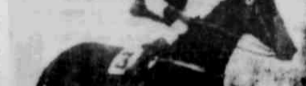
ENTROU NA ESFERA CLÁSSICA Pianista - por Pando e Melodia - venceu, com mérito, o Prêmio "Assembléia Legislativa", principal competição da tarde turfística de domingo, desdobrada no hipódromo do Cristal.

O "meeting" ocorreu-se de ótimo nível, financeiro e moral, o que, como se sabe, muita gente foi a Bagé assistir ao acontecimento de gala de seu turf, fazendo transportar para a casa dos apostas, entre sábado e domingo, mais de dez milhares de cruzeiros. E não houve, também, defeito de raras ou quase raras apostas.