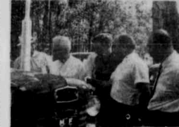
O PRÊMIO DE UM CAMPEÃO