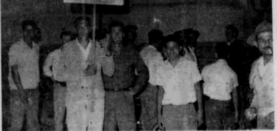
ESFORÇOS DE NADA VALERAM. Não obstante os esforços da classe patronal e das autoridades às quais esta ajeto o problema...