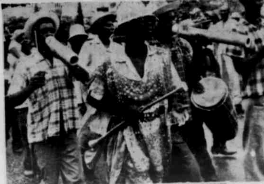
APOIO A DUVALIER

Jerusalem, 13 (UPI) — O Parlamento israelita foi cenário hoje de uma discussão, quando o primeiro ministro, David Ben Gurion, acusou o partido adversário Herut, de haver elogiado Hitler. Os deputados desse setor interromperam a sessão e chamaram o chefe do governo a se retirar da sala. O Parlamento reiniciou suas deliberações quando Ben Gurion aceitou retirar suas expressões ofensivas.